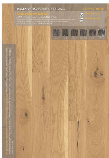
Eiche PURE wild bunt