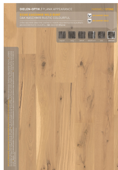
Eiche KASCHMIR wild bunt